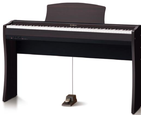
CL26 Palisandro Premium