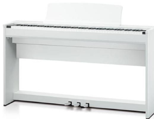
CL36 Blanco Satinado Premium